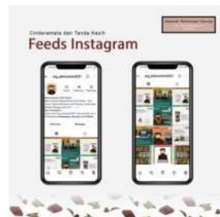
Gambar 17. Instagram Feeds