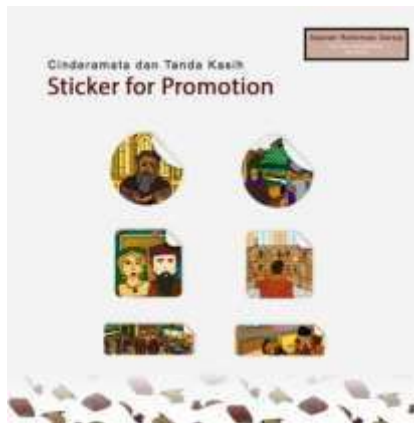
Gambar 18. Stiker