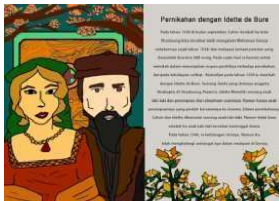
Gambar 10. Halaman 15 dan 16 Buku