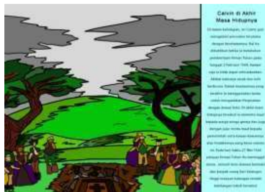
Gambar 13. Halaman 21 dan 22 Buku