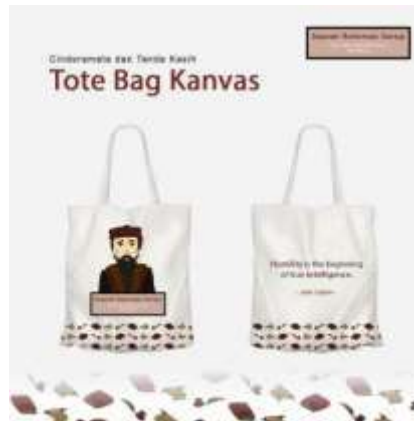
Gambar 21. Tote Bag