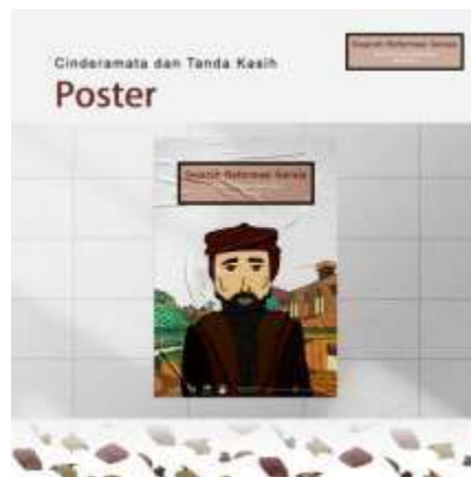
Gambar 15. Poster