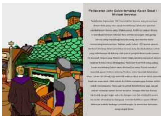
Gambar 11. Halaman 17 dan 18 Buku