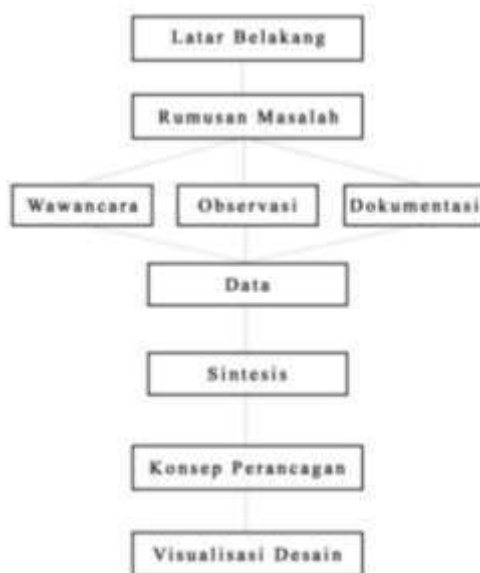
Gambar 1. Model Perancangan

Dalam melakukan perancangan buku ilustrasi tersebut diperlukan metode pelaksanaan atau metode perancangan dalam membantu kelengkapan data yang telah didapatkan. Metode perancangan yang dipakai adalah model perancangan menurut Sanyoto (2006: p.38) dengan hasil implementasi dari penulis :