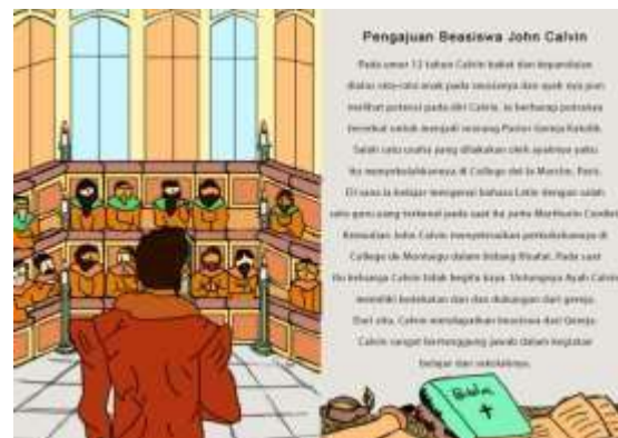
Gambar 5. Halaman 5 dan 6 Buku