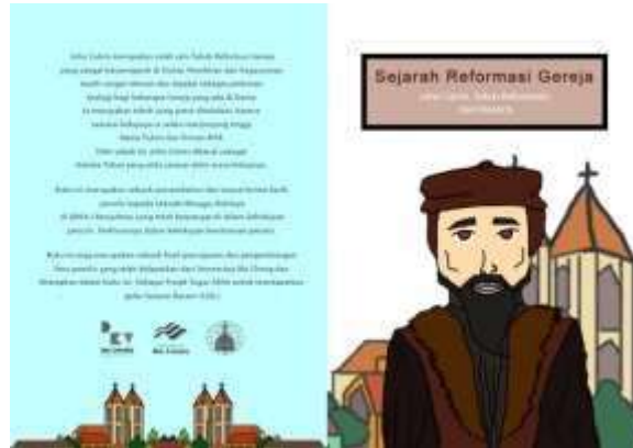
Gambar 1. Cover Buku

serta tambahan lain berupa lembar penerbit, lembar judul, dan 2 halaman penuh untuk quotes dari tokoh John Calvin. Dari hal-hal tersebut maka berikut merupakan hasil perancangan tersebut.