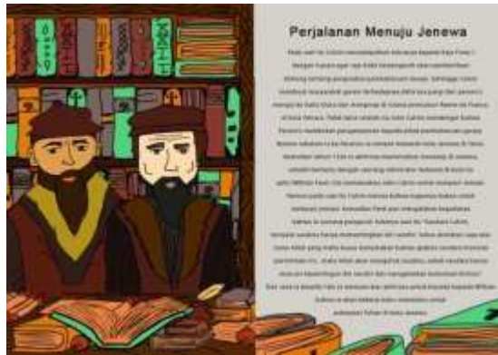
Gambar 8. Halaman 11 dan 12 Buku