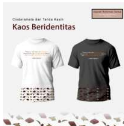
Gambar 22. Kaos Beridentitas