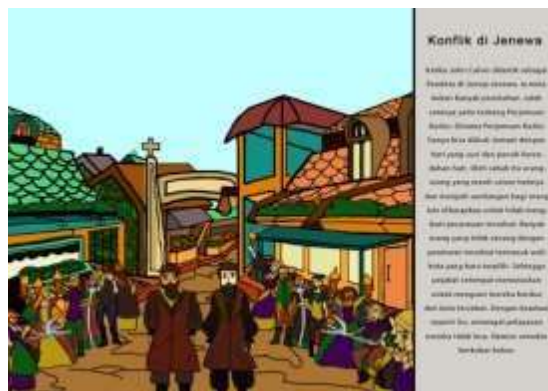
Gambar 9. Halaman 13 dan 14 Buku