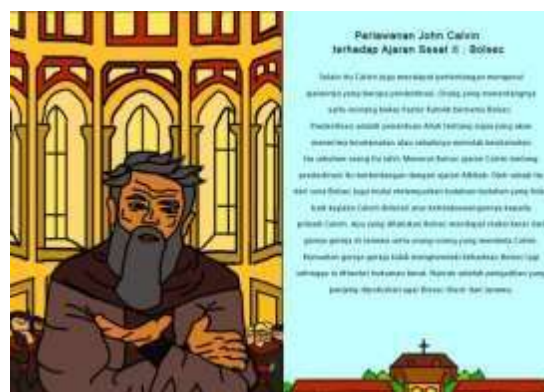
Gambar 12. Halaman 19 dan 20 Buku