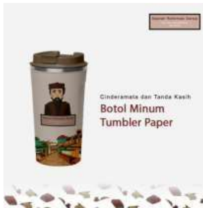
Gambar 19. Tumbler