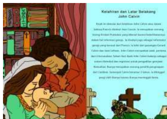
Gambar 3. Halaman 1 dan 2 Buku