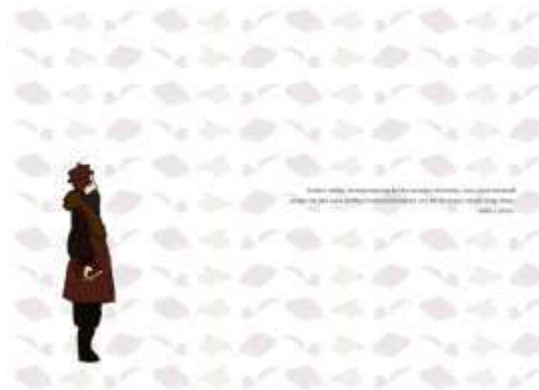
Gambar 14. Penutup dan Kata Bijak