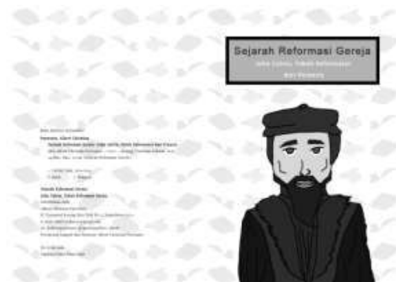
Gambar 2. Lembar Penerbit dan Judul Buku