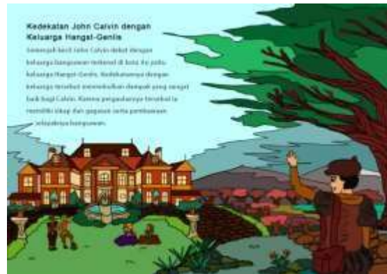
Gambar 4. Halaman 3 dan 4 Buku