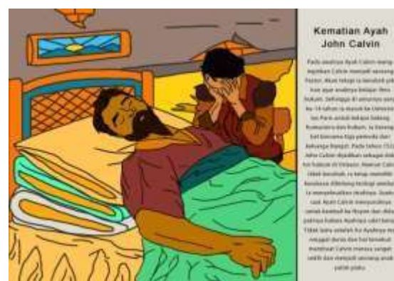
Gambar 6. Halaman 7 dan 8 Buku