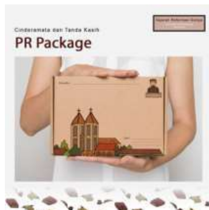
Gambar 16. PR Package